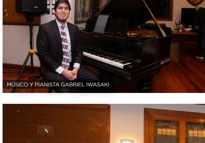
MÚSICO Y PIANISTA GABRIEL IWASAKI