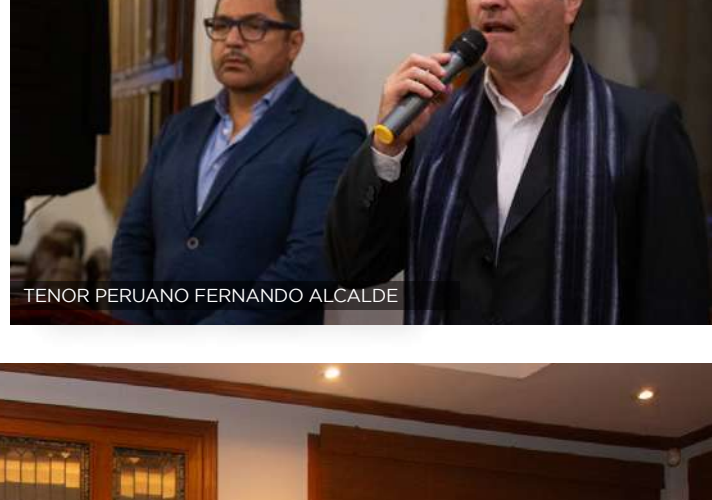
TENOR PERUVIANO FERNANDO ALCALDE